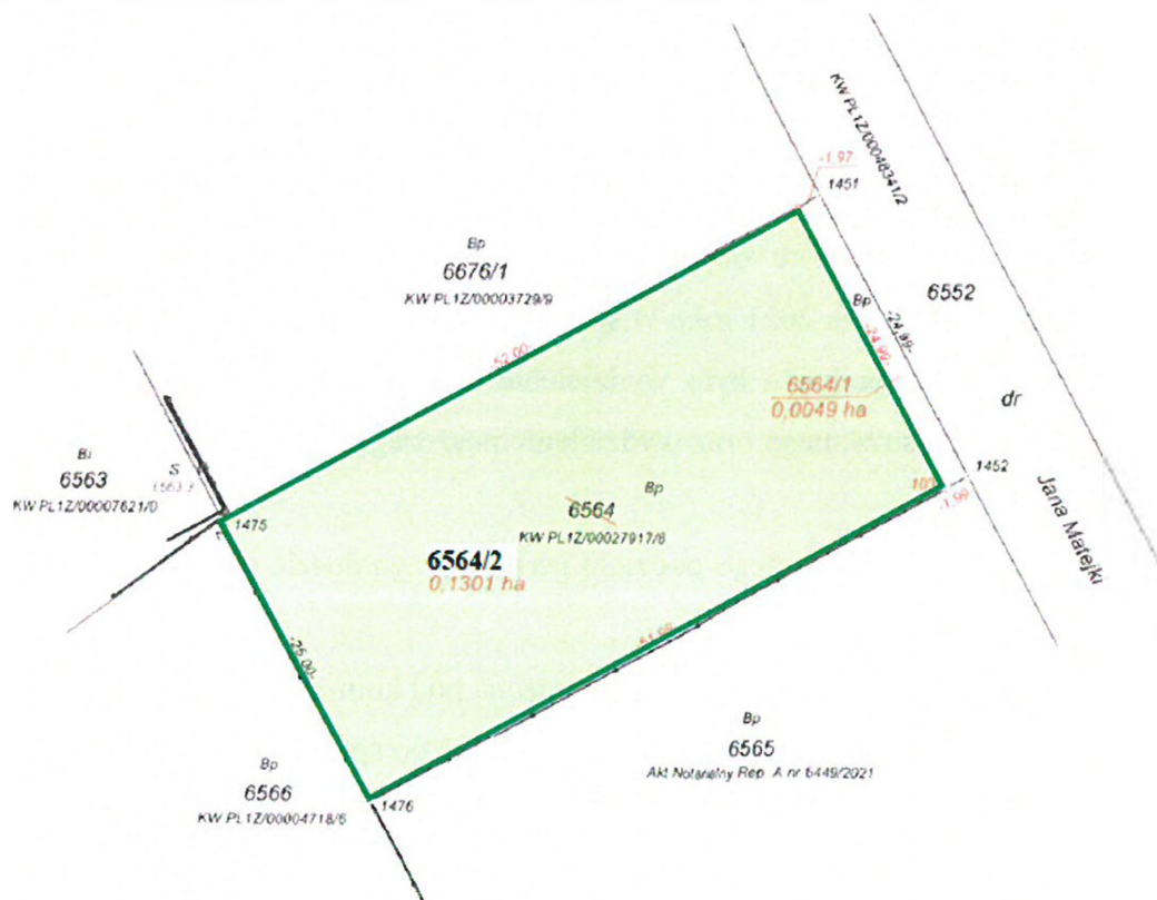
ul. Jana Matejki 29 (nowo wydzielona działka ewid. nr 6564/2)