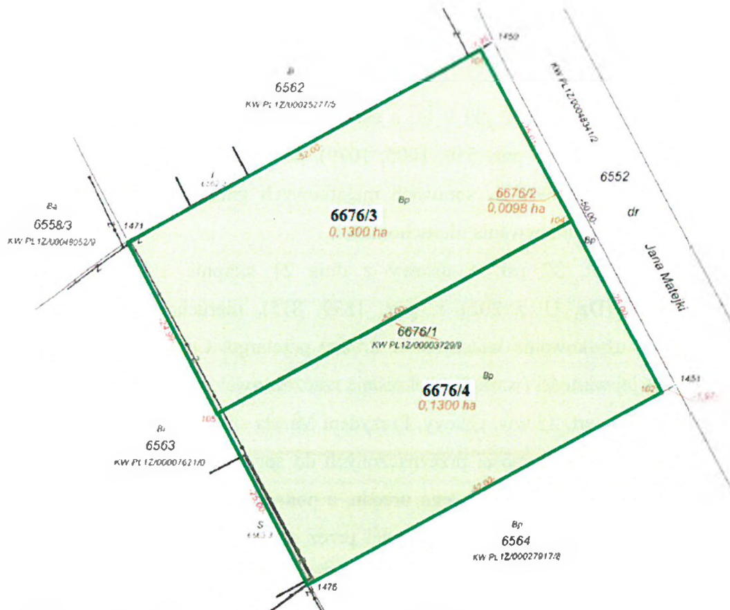
ul. Jana Matejki 31-33 (nowo wydzielone działki ewid. nr 6676/3 i 6676/4)