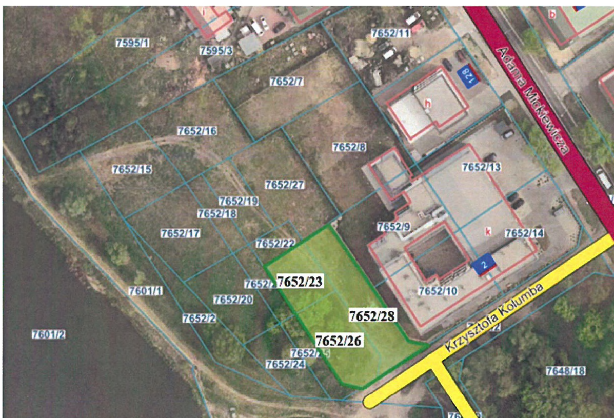
Działki ewid. nr 7652/23, 7652/26 i 7652/28 przy ul. Krzysztofa Kolumba