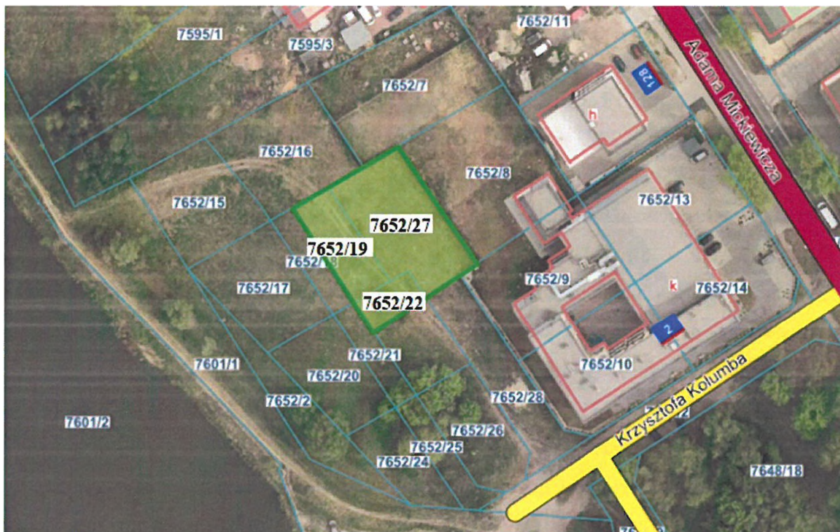
Działki ewid. nr 7652/19, 7652/22 i 7652/27 przy ul. Krzysztofa Kolumba