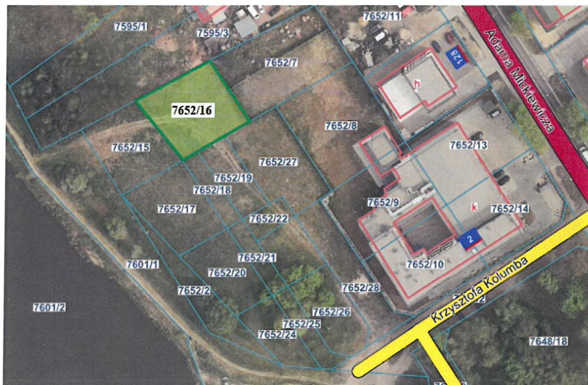
Działka ewid. nr 7652/16 przy ul. Krzysztofa Kolumba

Podjęcie uchwały umożliwi rozpoczęcie opisanej wyżej procedury sprzedaży nieruchomości.