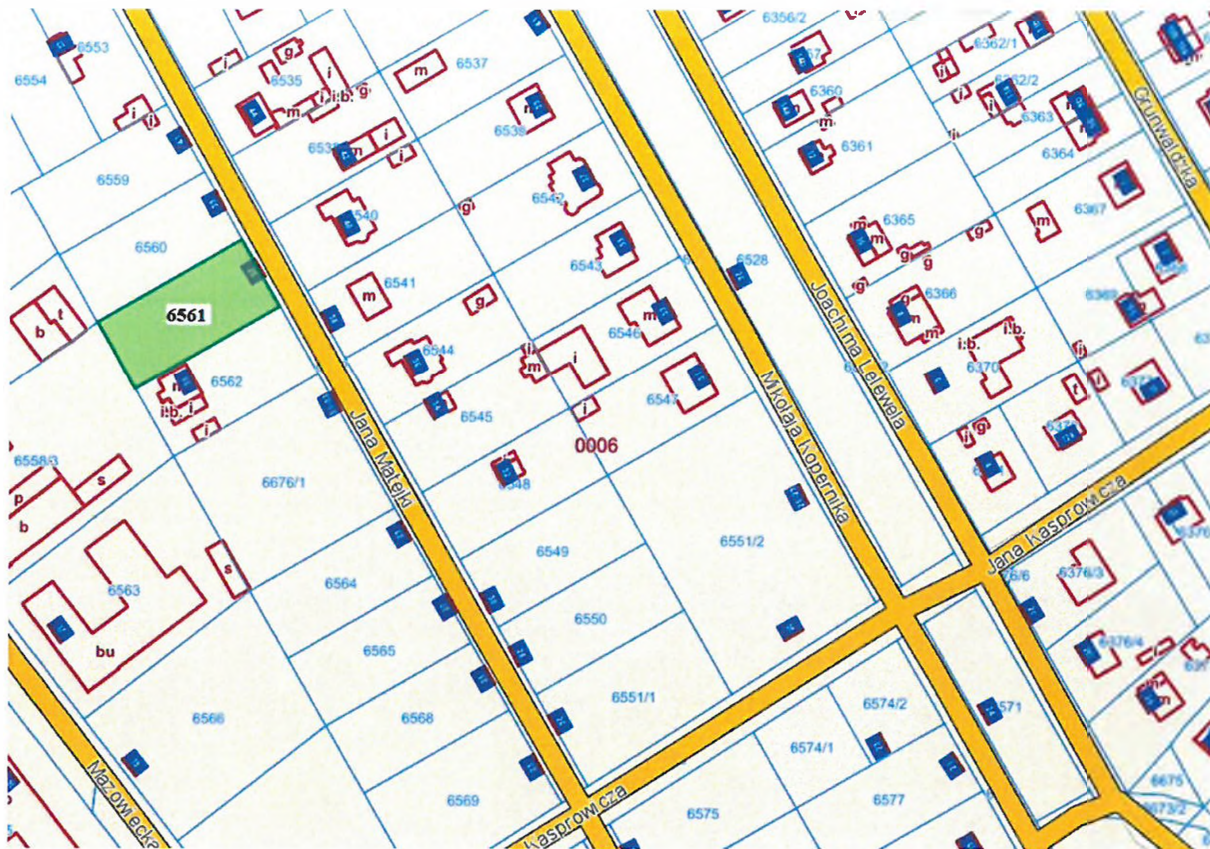
ul. Jana Matejki 37 (dz. ewid. 6561)