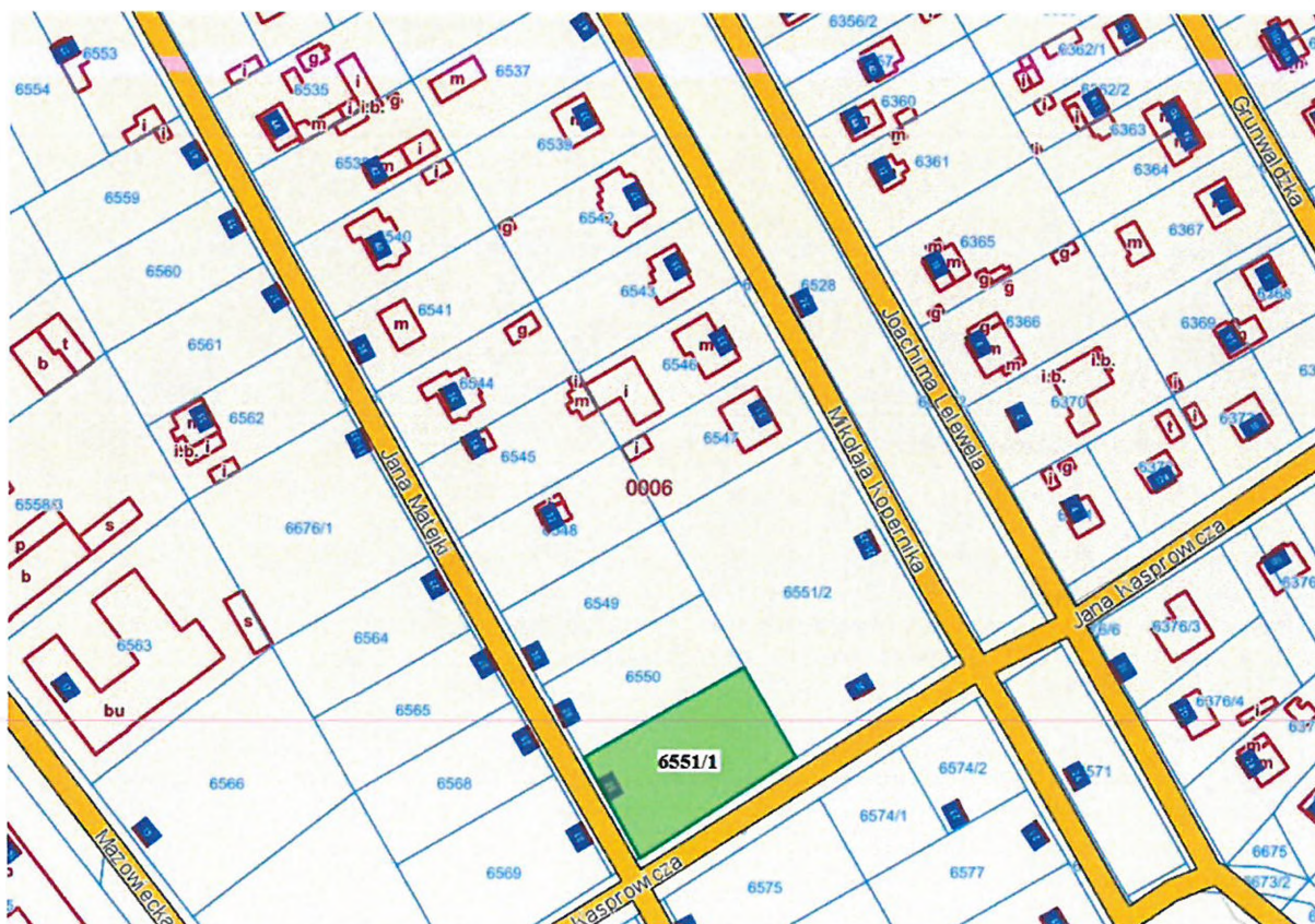
ul. Jana Matejki 26 (dz. ewid. 6551/1)