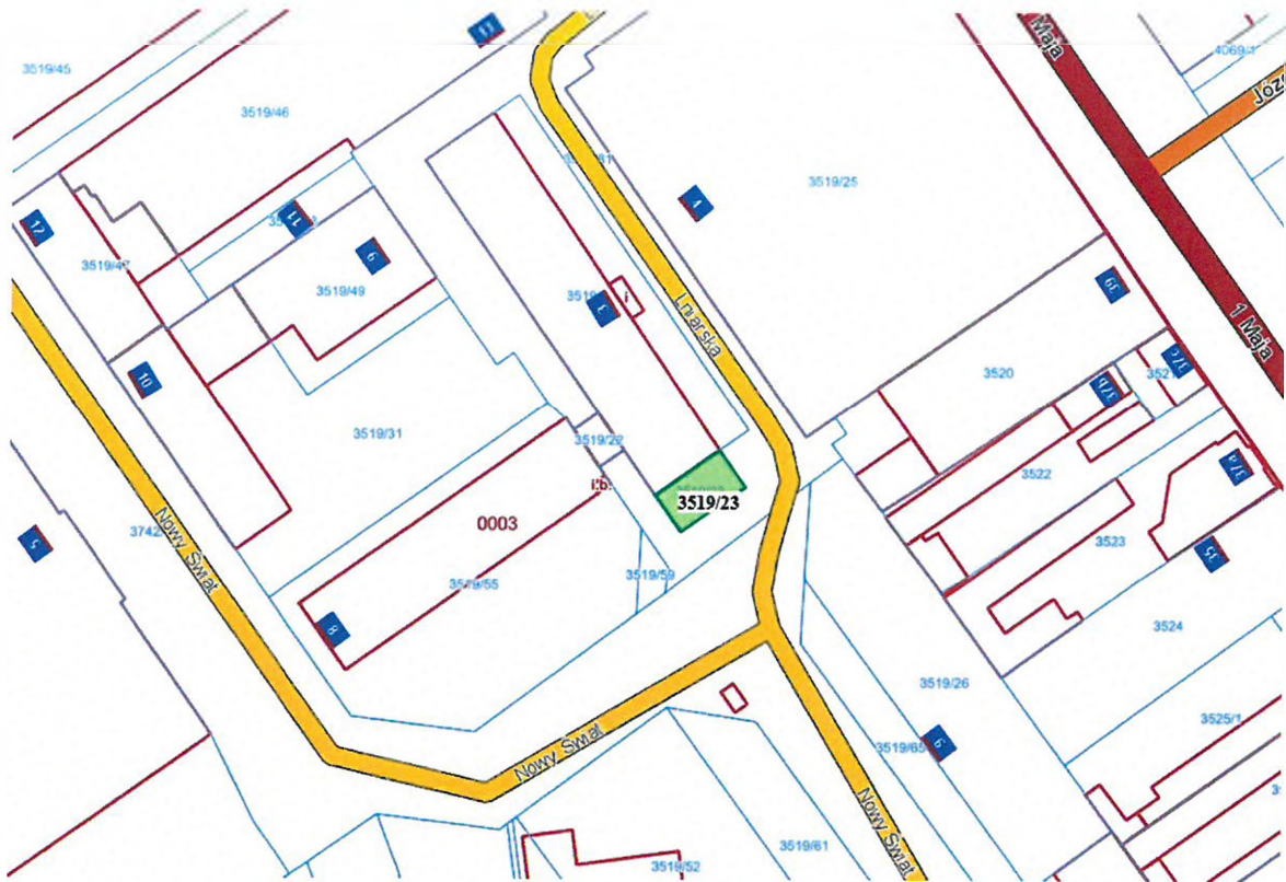
ul. Lniarska/Nowy Świat (dz. ewid. 3519/23)