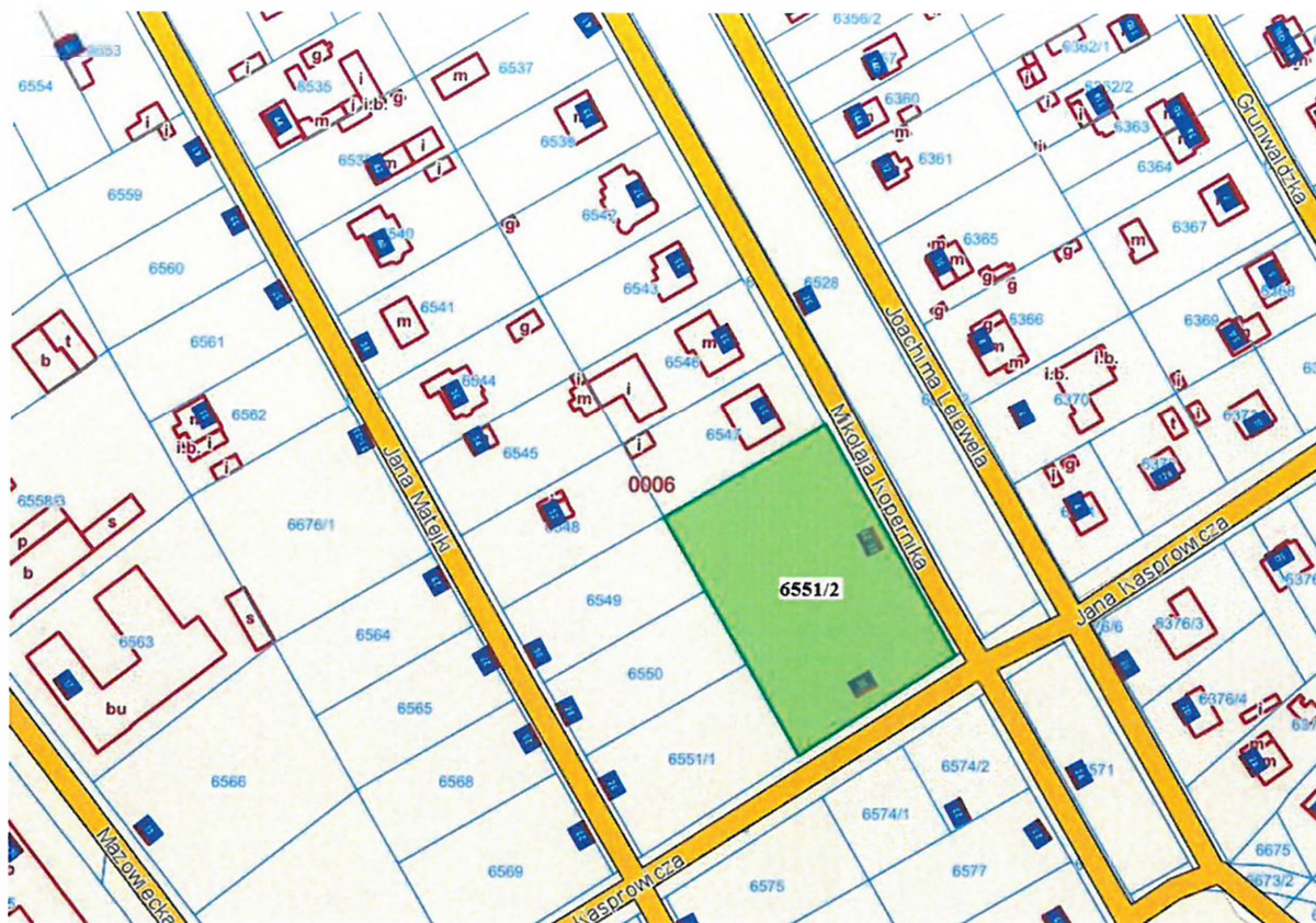
ul. Mikołaja Kopernika 25-29 (dz. ewid. 6551/2)