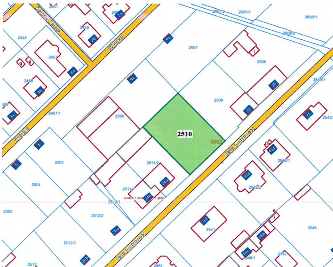
ul. Jana Kilińskiego (dz. ewid. 2510)