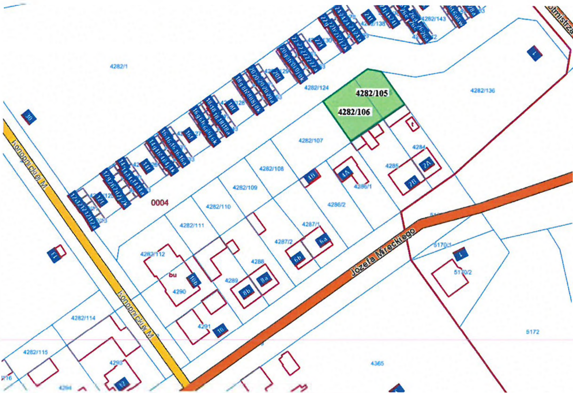
ul. Józefa Mireckiego (dz. ewid. 4282/105 i 4282/106)